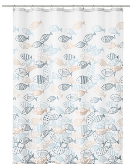
DUSCHVORHANG SARDINAS: 180x200 cm, 100% Polyester, Multicolor, 31,99 €

Für saisonale Abwechslung im Bad oder Gäste-WC sorgen die vielfältigen Accessoires des Badspezialisten – so auch in der Designwelt „EINFACH MEER“. Wie alle Kleine Wolke-Duschvorhänge überzeugt das Modell „SARDINAS“ mit beliebten Qualitätsstandards wie der hochwertigen Kalanderverarbeitung sowie dem doppelten Saum für mehr Stabilität. Die tummelnden Fische schaffen eine lebhaftere Atmosphäre, die durch das stimmige Farbschema dennoch gelassen wirkt. Kleine Akzente wie das Accessoire-Set „NAVAGIO“ werten eine sonst schlichte Einrichtung optisch auf: Zahnputzbecher, Seifenspender und WC-Bürstenhalter sind aus unempfindlichem und langlebigem Steinzeug. Dank der naturfarbenen Töne und Muster lässt sich das Set in jeden Einrichtungsstil integrieren. Das Tüpfelchen auf dem i stellt der geflochtene, multifunktionale Aufbewahrungskorb „ASPERA“ in Mare dar, der den maritimen Look im Bad optimal abrundet.