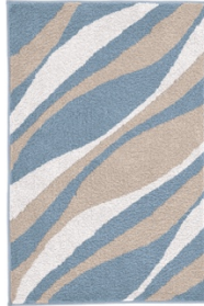
BADTEPPICH DREAM: versch. Maße, 100% Polyacryl, Stahlblau, ab 52,99 €