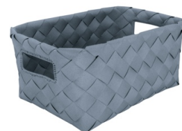
AUFBEWAHRUNGSKORB ASPERA: Polypropylen, Mare, 17,99 €