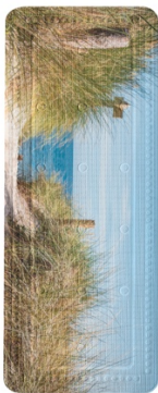
WANNENEINLAGE BORKUM: PVC, versch. Maße, Multicolor, 25,99 €

Weitläufige Sanddünen gepaart mit einer salzigen Meeresbrise – das ist der Inbegriff von Borkum. Die gleichnamige Wanneneinlage , der WC-Sitz und Duschvorhang von Kleine Wolke beeindrucken mit einem hochwertigen, fotorealistischen Druck – ein Must-Have für Fans der ostfriesischen Insel! Hand in Hand mit dem auffälligen Design gehen Qualitäts- und Komfortmerkmale wie die Absenkautomatik des WC-Sitzes oder die zuverlässige Haftung der Wanneneinlage.