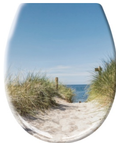
WC-SITZ BORKUM: Duroplast, Multicolor, 59,99 €