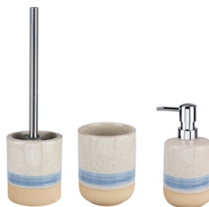
ACCESSOIRE-SERIE NAVAGIO: Steinzeug, Stahlblau, ab 9,99 €