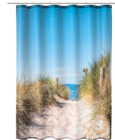
DUSCHVORHANG BORKUM: 180x200 cm, 100% Polyester, Multicolor, 39,99 €

Wie frische Meeresluft bringt Kleine Wolke mit der neuen Designwelt „EINFACH MEER“ Leichtigkeit und Gelassenheit ins Bad: Alle Artikel sind ab sofort auf www.kleinelwolke.com sowie im Fach- und Möbelhandel erhältlich.