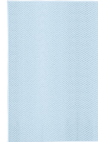
BADTEPPICH ZIGZAG: versch. Maße, 100% Polyester, Hellblau, ab 39,99 €